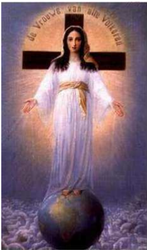
Panna Maria, Matka všech národů